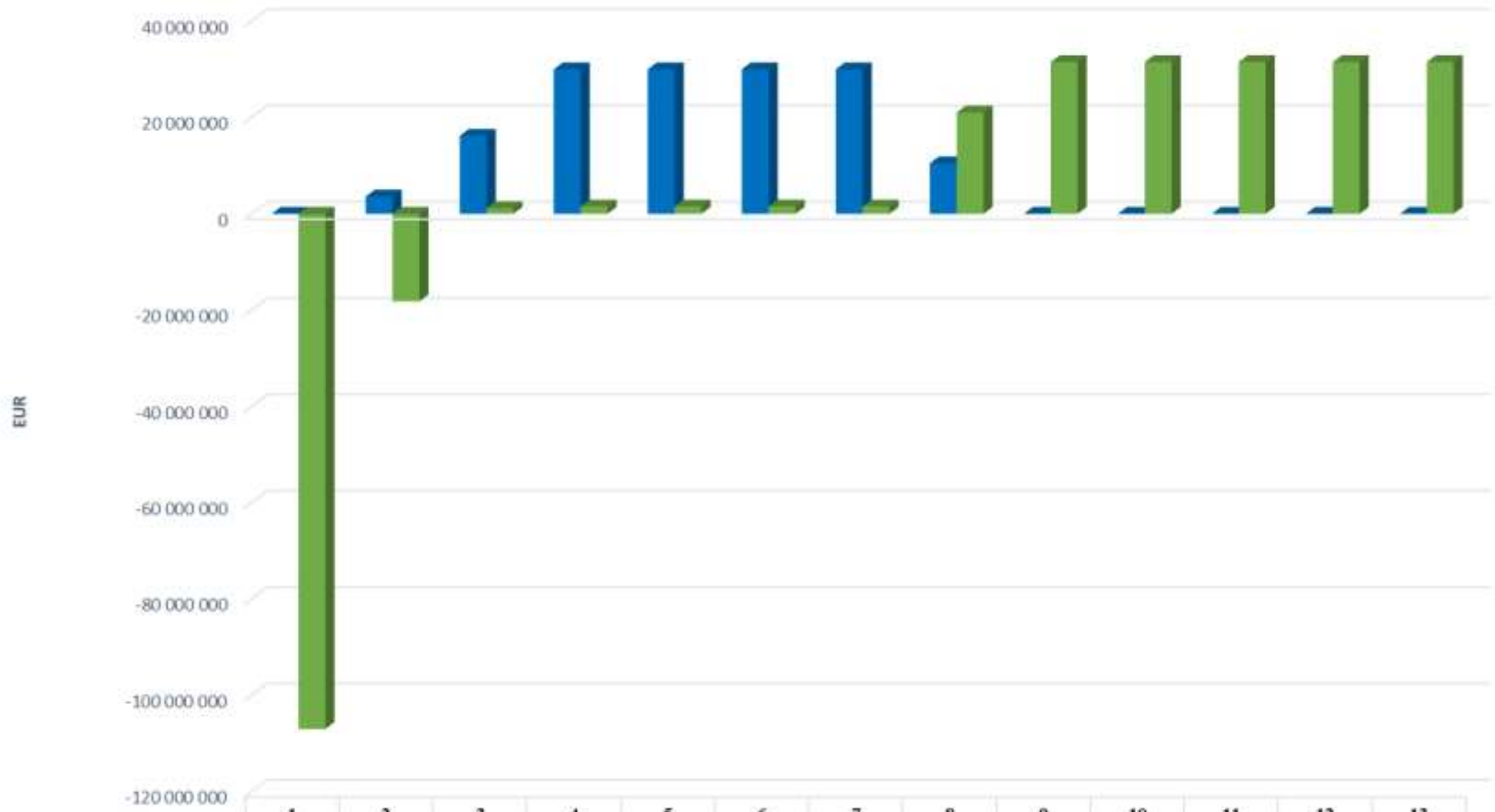
Графік повернення інвестицій та вихід на чистий дохід по рокам з врахуванням переробки (Варіант 2)